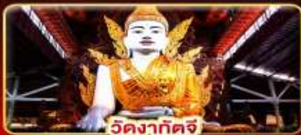
วัดงาทัดจี

สิทธิการะ 3 มหาบุชาสถาน พักบนอินทร์แวงน 1 คืน