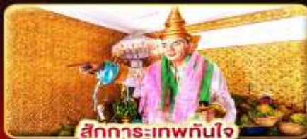
สิทธิการะเทพทันใจ