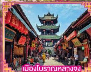
เมืองโบราณหลางจง