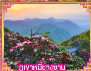
ภูเขาหมีช้างซาน