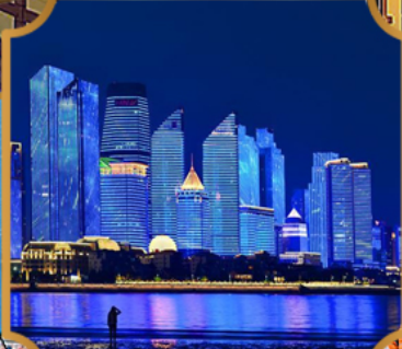
หาดโซเบอร์ฟังก์