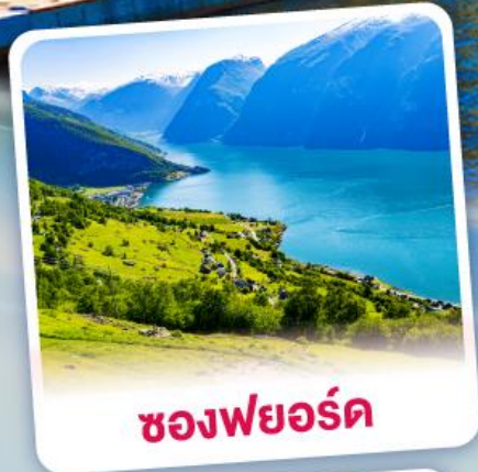
ช่องฟยอร์ด