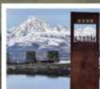
ป่ากลางเฉิงตู