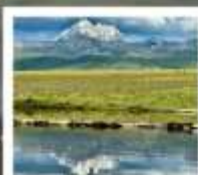
ดวงดาวแห่งถ้ำกาง