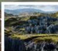
สวนหินป่าเหมย