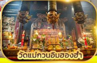
วัดแม่กวนอิมสองข่า