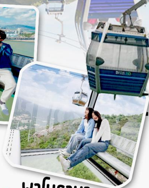
พานิราม่า