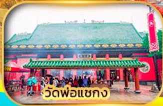
วัดพ่อแชกง