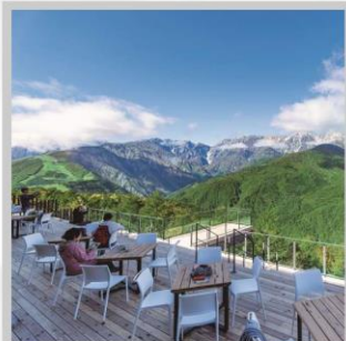
“HAKUBA MOUNTAIN HARBOR”

นำท่านไปโอบกอดธรรมชาติที่ครบครันในที่เดียว “คามิโคจิ” สวิสเซอร์แลนด์แดนญี่ปุ่นเทือกเขาที่ปกคลุมด้วยหิมะสวยงาม ชมความงามของ “ทุ่งพืชมอส ฟุจิชิบะซากุระ” มนต์เสน่ห์..พรมธรรมชาติสีชมพูหลากสีสดใส เปลี่ยนอริยาบท “ขึ้นกระเช้าฮาคุบะ อิวะตะเกะ” เพื่อชมวิวพาโนรามาของเทือกเขาแอลป์ญี่ปุ่นกันให้อิ่มใจ สัมผัสกลิ่นอายเมืองเก่า “เมืองทาคายามา” ที่ยังคงอนุรักษ์ความเป็นอยู่ เมื่อสมัยเอโดะกว่า 300 ปี สายช้อปปิ้งห้ามพลาด “คารุอิซาวะ เอ้าท์เล็ต” แลนด์มาร์กของเมืองคารุอิซาวะ และ “ย่านชินจุกุ” แห่งเมืองโตเกียว ชมความงามกับเส้นทาง “เจแปนแอลป์ (กำแพงหิมะ)” สุดยอดของการท่องเที่ยวที่ถูกขนานนามว่า “หลังคาแห่งญี่ปุ่น”