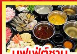
บุฟเฟ่ต์ซาบู