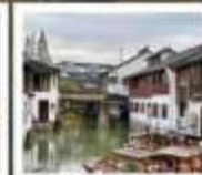
เมืองโบราณซูเจียเจียว