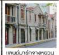
แลนด์มาร์กจางหยวน

เซี่ยงไฮ้ คคลาสสิก ไนท์ / 3 ดึกใหญ่แห่งเซี่ยงไฮ้ คองเรือหมู่บ้านโบราณจูเจียเจียว / EKA Tianwu / วัดหลงหัว แลนด์มาร์ก จางหยวน / ถนนหวยไห่ / ชมโชว์ ERA ที่โรงละครโด่งดังระดับโลก / ซินเทียนตี้