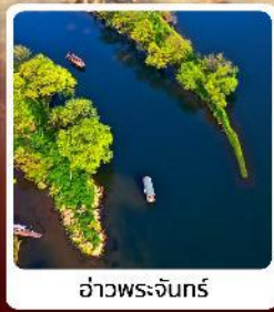
อ่าวพระจันทร์

● ไโอไทร์ เช็คอิน ลั่วซิงตุน หอคอยดาวตกแห่งเจียงซี หูบเขาวังเซี่ยนกุ๋ ดินแดนสวยดุจเทพนิยาย