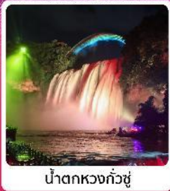
น้ำตกหวงกั๋วซู่