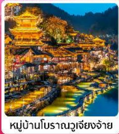
หมู่บ้านโบราณวูเจียงจ้าย