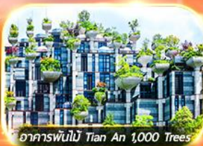
อาคารพันไม้ Tian An 1,000 Trees