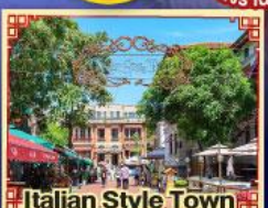
Italian Style Town