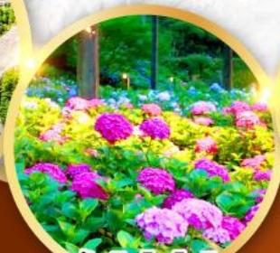
วัดมิมุโระโทจิ