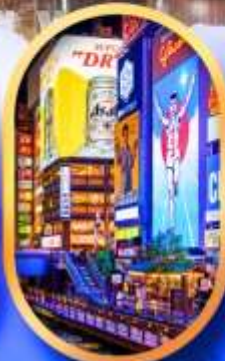
ย่านชิบโฮบาชิ