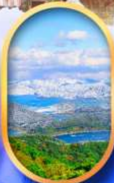
ทะเลสาบมิกะตะ