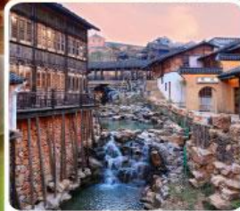
เมืองโบราณเหยาหู