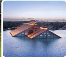
พิพิธภัณฑ์ไต้หน้ำกวงฟู่หลิน