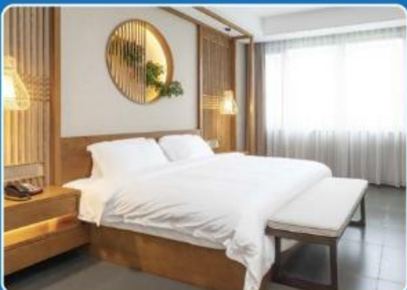
👤👤 DOUBLE (DBL)