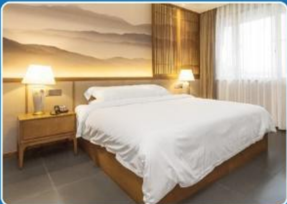
👤 SINGLE (SGL)