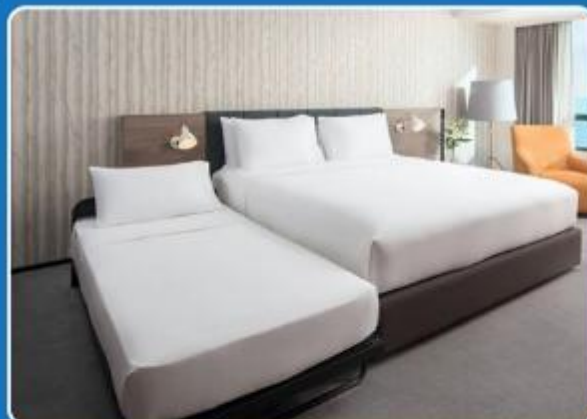
👤👤+👤 TRIPLE (TRP)

**รูปภาพห้องพักเป็นเพียงภาพสื่อถึงประเภทของเตียงเท่านั้น ไม่ใช่ภาพห้องพักจริงสำหรับการเข้าพัก**