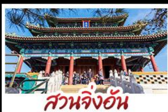
สวนจิ่งอัน