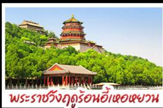
พระราชวังฤดูร้อนอี๋เหอหยวน

กำแพงเมืองจีนด่านจวิรงกวน - พระราชวังฤดูร้อนอี๋เหอหยวน สวนจิ่งอัน - วัดลามะ - ไหม่หลงร้านช้อปปิ้ง - โรงแรม 4 ดาว บ๊อพิศษ เปิดปักกิ่งที่ สุกิมองโก MICHELIN GUIDE ร้าน TAO TAO JU