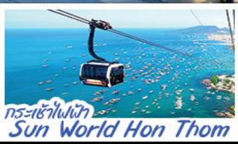
กระเช้าไฟฟ้า Sun World Hon Thom