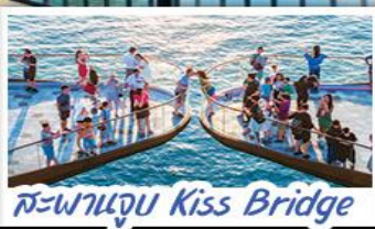
สะพานจูบ Kiss Bridge