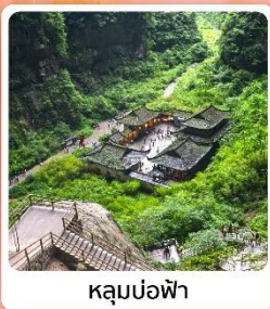
หลุมบ่อฟ้า