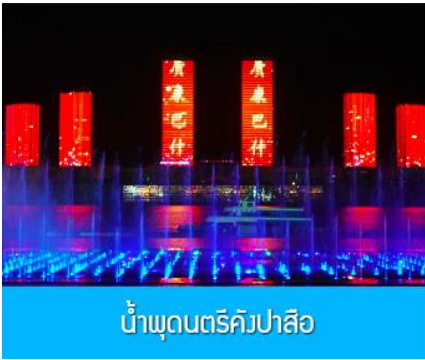
น้ำพุดนตรีคังปาสือ