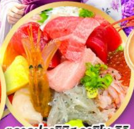
ตลาดปลาฮิมสุ คาชิโนะอิชิ