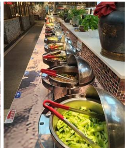
ที่พัก REZEN SUNGO HOTEL หรือระดับเทียบเท่า 4 ดาว(มาตรฐานจีน)