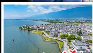
ทะเลสาบเอ๋อไห่