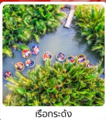
เรือกระดั่ง