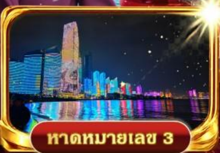
หาดหมายเลข 3