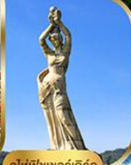
จูไห่ฟิชเชอร์ทรี