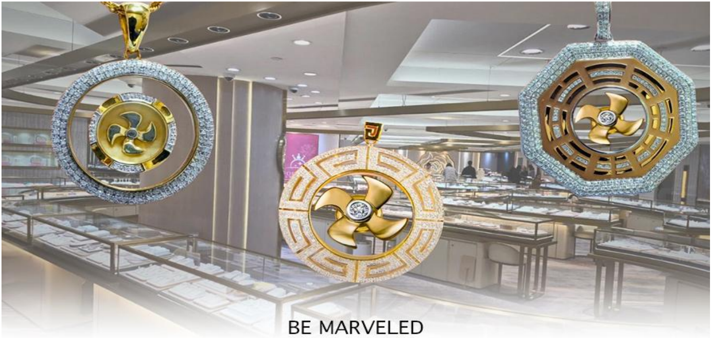
BE MARVELED ศูนย์ฮวงจุ้ย กังหันเศรษฐี

นำท่านชม ศูนย์ฮวงจุ้ย กังหันเศรษฐี ที่ขึ้นชื่อของฮ่องกง ท่านจะได้พบกับงานดีไซน์ที่ได้รับรางวัลยอดเยี่ยม และใช้ในการเสริมดวงเรื่องฮวงจุ้ย โดยการย่อใบพัดของกังหันที่เป็นสัญลักษณ์ของวัดวัดเซ่งจี้มาทำเป็นเครื่องประดับ ไม่ว่าจะเป็นจี้, แหวน, กำไล หรือต่างหูเพื่อเป็นเครื่องประดับติดตัว และเสริมดวงชะตา ซึ่งสินค้าทุกชิ้น มีเอกสาร รับประกันคุณภาพเปลี่ยนหรือซ่อม ได้ตลอดอายุการใช้งาน หากเกิดการชำรุดจากสินค้าไม่ใช่อุบัติเหตุ