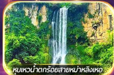
หุบเขาน้ำตกร้อยสายหม่าหลิงเหอ

ชมวิถีชีวิตหมู่บ้านปู้อี้ยามค่ำคืน, ล่องเรือทะเลสาบว่างเฟิงหู ชมสวนดอกไม้ตามฤดูกาล, ซอปปิ้งจุใจถนนคนเดิน