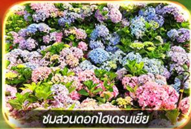
ชมสวนดอกไฮเดรนเยีย