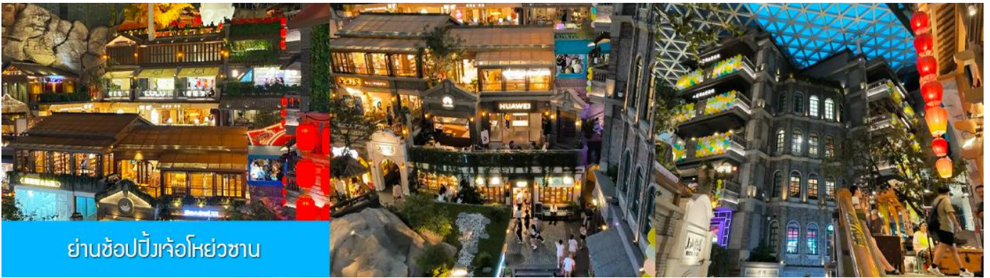
ย่านช้อปปิ้งเจ้อห้วยซาน

นำท่านเที่ยวชม ย่านช้อปปิ้งเจ้อห้วยซาน 这有山 แหล่งช้อปปิ้งจีนชื่อที่ผสมผสานระหว่างสถานที่ท่องเที่ยว และแหล่งรวมร้านค้า และร้านอาหารฟาสต์ฟู้ด อาหารพื้นเมืองร่วมสมัย ภายใต้คอนเซ็ปต์ แหล่งช้อปปิ้งบนภูเขา และบนภูเขามีแหล่งช้อปปิ้ง เป็นจุดเช็คอินยอดนิยมที่เปิดให้คนพื้นที่และนักท่องเที่ยวเข้าชมตั้งแต่ปี ค.ศ. 2019