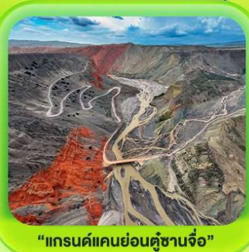
"แกรนด์แคนยอนคู่ชานโจว"

ซินเจียงเหนือ ทะเลสาบไซลี่มู่ "น้ำตกหายสุดท้ายของแอตแลนติก" • กุ่มหญ้านาราภิบาล กุ่มดอกไม้เทียนซาน • ผ่านชมสะพานกั๋วจื่อโกว • ถนนหลิวซิงเจียง • ตลาดต้าปาจา