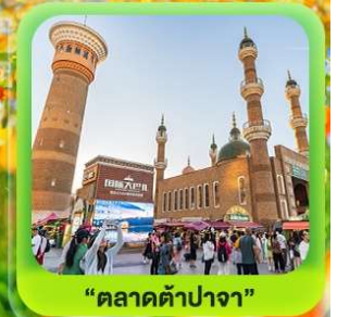
"ตลาดต้าปาจา"

ซินเจียงเหนือ ทะเลสาบไซลี่มู่ "น้ำตกหายสุดท้ายของแอตแลนติก" • กุ่มหญ้านาราภิบาล กุ่มดอกไม้เทียนซาน • ผ่านชมสะพานกั๋วจื่อโกว • ถนนหลิวซิงเจียง • ตลาดต้าปาจา