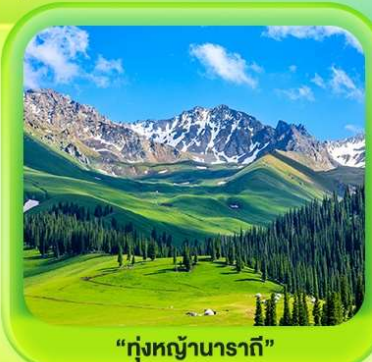
"กุ่มหญ้านาราภิบาล"