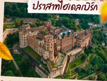
ปราสาทโชนเคปิร์ก