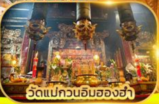
วัดแม่กวนอิมของฮ่า