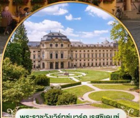
พระราชวังแวร์ซายส์ฝรั่งเศส