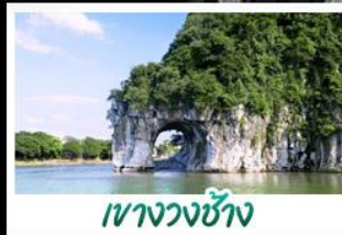
เขาวงกตช้าง