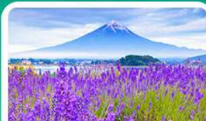
สวนโออิชิปาร์ก