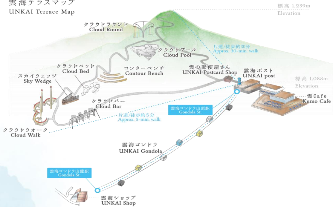
雲海テラスマップ UNKAI Terrace Map

เดินทางสู่ เมืองอาซาฮิคาว่า เป็นเมืองที่ใหญ่เป็นอันดับสองของเกาะฮอกไกโด รองจากนครซัปโปโระมีร้านค้าที่ขายข้าวและผักที่ปลูกได้ในเมือง และยังมีร้านขายอาหารทะเลตั้งอยู่มากมาย การคมนาคมสมบูรณ์แบบ ทำให้แต่ละปีมีผู้มาท่องเที่ยวกว่า 5 ล้านคนจากทั้งในและต่างประเทศ