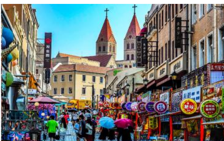
ถนนจงซาน