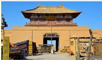
เมืองโบราณตุนหวง