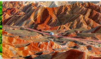
ภูเขาสายรุ้งจางเย่ต้นเสี่ย