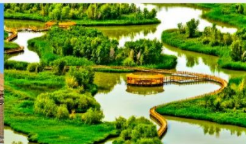
อุทยานพื้นที่ชุ่มน้ำจางเย่