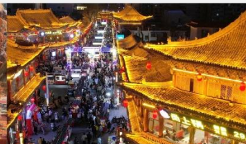
ตลาดกลางคืนจางเย่

*ทางบริษัทฯ ขอสงวนสิทธิ์ในการสลับโปรแกรมทัวร์ตามความเหมาะสมขึ้นอยู่กับสถานการณ์หน้างาน โดยคำนึงถึงผลประโยชน์ของลูกค้าเป็นสำคัญ