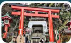
ศาลเจ้าอินะชิมะ