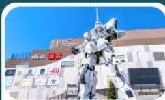
ห้างไดเวอร์ซิตี