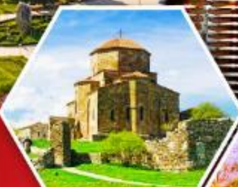
วิหารจอร์เจีย